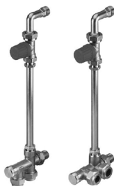
С медным подключением