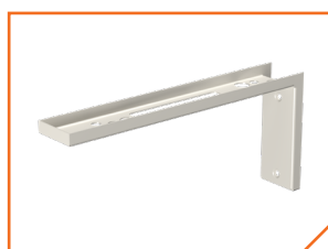
a4086 Кронштейн BS-K-3

Знак безопасности: VL-3015В. Способ крепления — на двухсторонний скотч.