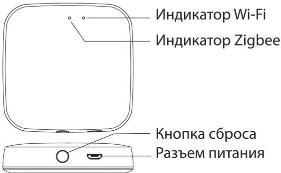
Рис. Устройство шлюза

Дополнительные технические характеристики