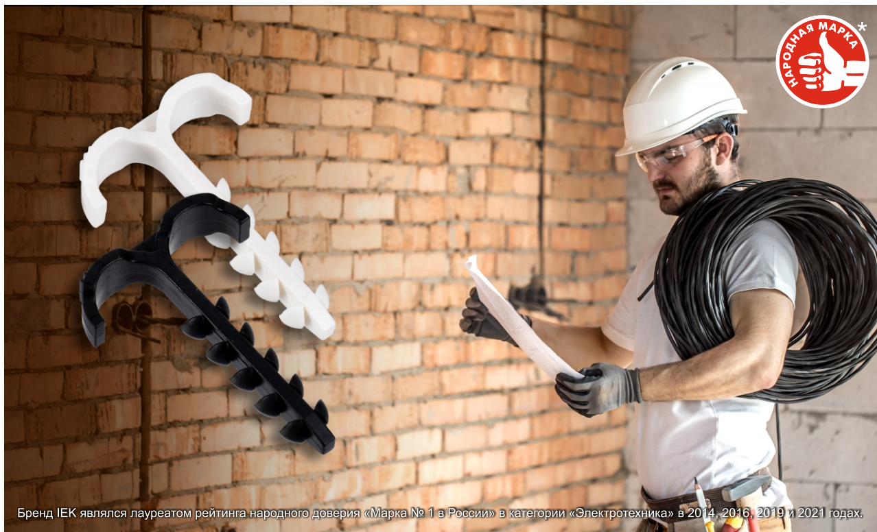
Бренд IEK являлся лауреатом рейтинга народного доверия «Марка № 1 в России» в категории «Электротехника» в 2014, 2016, 2019 и 2021 годах.

Дюбель-хомут Т-образный IEK® изготовлен из полиамида 6.6 высокой прочности. Его особенная Т-образная форма сочетает два элемента: дюбель и скобу. Это позволяет проложить 2 кабеля одновременно как вертикально, так и горизонтально. Дюбель-хомут одинаково эффективен при прокладке кабеля в кирпичных и блочных стенах, бетонных перекрытиях, потолках, полах и фундаментах. Это удобный, быстрый и экономически выгодный способ крепления кабелей при проведении электромонтажных работ.